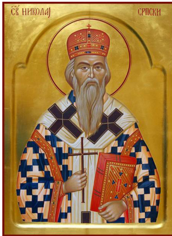
Sf. Nicolae Velimirovici

Pe când demonii se rugau de Hristos cu frică și cutremur, o turmă mare de porci, ca la două mii (Marcu 5, 13), pășteau liniștiți pe deal. Demonii L-au rugat pe Iisus: Dacă ne scoți afară, trimite-ne în turma de porci. Adică: Nu ne azvârli în adânc, ci măcar trimite-ne în trupurile porcilor. Dacă ne scoți afară... Nu zic: afară din om; nici măcar nu pomenesc de om, într-atât era acesta de mort pentru dânșii. Din toate făpturile din univers, niciuna nu este atât de urâtă și de pizmuită de demoni ca omul. Mântuitorul, dimpotrivă, apasă asupra cuvântului „om”: Ieși duh necurat din omul acesta (Marcu 5, 8). Demonii nu vor să plece din om; lor le-ar fi plăcut la nesfârșit să stea în om decât să meargă în porci, pentru că de ce folos le erau lor porcii? Pe când pe oameni demonii îi pot face să fie ca porcii, ba chiar mult mai rău ca porcii, cu porcii ce pot face? Oricum, chiar