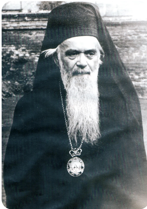
Sfântul Nicolae Velimirovici

La El fapta se împlinește numai „cu cuvântul”.