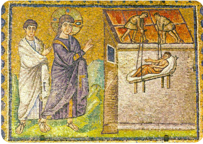
Vindecarea Slăbănogului din Capernaum, basilica Sf. Apolinarie, Ravenna

huri mai rele decât cel dintâi se vor năpusti asupra lui și-l vor cuprinde (Luca 11 24-26). Hristos e ca o cum-pănă a apelor: Oriunde apare El, oamenii se împart în doua tabere: cei ce se bucură de bine și cei ce nu se bucură. Așa este astăzi, și așa era și în vremea când Domnul pășea pe pământ în trup omenesc. Evanghelia de astăzi ne înfățișează această înfricoșată despărțire a oamenilor în fața Celui ce arată binele, în fața Domnului și Mântuitorului nostru Iisus Hristos.