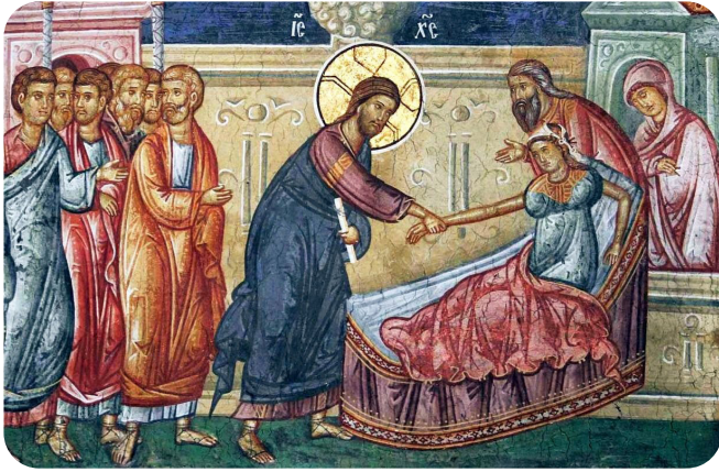
Învierea fiicei lui Iair

era răpusă de aceasta și se afla în mare pericol! Mântuitorul a încuviințat și a mers împreună cu acesta, ba chiar s-a grăbit către casa celui care L-a chemat și știa că ceea ce avea să facă, avea să fie spre folosul multora dintre cei care Îl urmau și spre slava Sa. Pe drum, a mântuit și o femeie care era victima unei boli necruțătoare și fără leac, căci nimeni nu îi putuse opri curgerea de sânge care depășise în pricepere pe toți doctorii vremii. Dar îndată ce cu credință s-a atins de El, a fost vindecată. O minune atât de preamărită a fost, ca să spunem așa, numai lucrarea călătoriei lui Hristos.