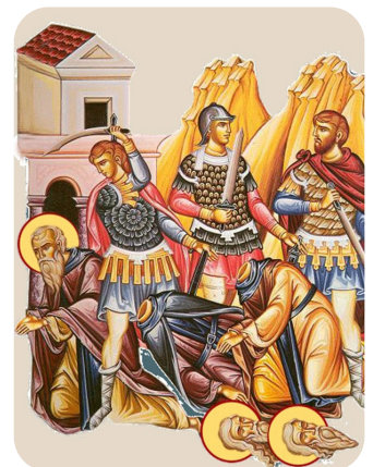
Sf. Cuv. Mucenici din Sinai și Rait

Slujitoare a cuvântului dumnezeiesc, cea întocmai cu Apostolii, Nina, lui Andrei cel întâi chemat și altor apostoli în apostolească propovăduire te-ai asemănat, luminătoarea Iviriei și alăută a Duhului Sfânt, roagă-L pe Hris- tos Dumnezeu să mântuiască sufletele noastre.