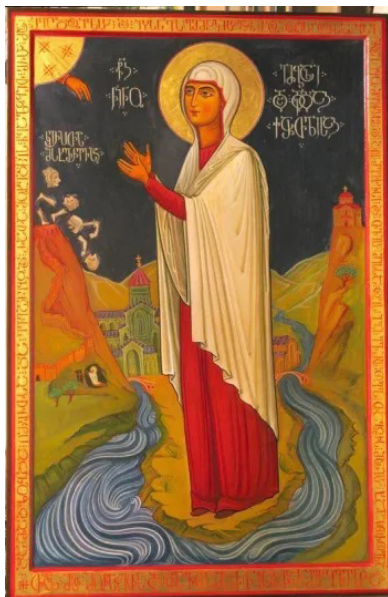
Sfânta Nina, cea întocmai cu Apostolii și luminătoarea Georgiei

Iar roșul împletit dă de înțeles iarăși prin sine modul întrupării Unuia Născutului. Căci Cuvântul fiind Dumnezeu, S-a împletit oare-cum cu carnea și sângele. Iar roșul închipuiește sângele și carnea. Căci se văd și sunt de aceeași culoare. Se taie deci pasărea în apă curgătoare, în care cea rămasă, împreună cu celelalte, se afundă și apoi e slobozită fără să pătească nimic, precum am spus mai înainte. Aceasta înseamnă că Hristos s-a jertfit pentru noi, dar era Același și în moarte și mai presus de moarte. «Căci a fost omorât cu trupul, după cum s-a scris, dar a fost făcut viu cu duhul, cu care s-a coborât și a propovăduit și duhurilor din închisoare, care odinioară nu ascul-taseră» (I Petru 2, 18-19). Întrucât se înțelege că S-a făcut om, a răb-dat moartea; iar întrucât este cu adevărat viața și din viață, S-a arătat mai presus de moarte. Și pasărea vie s-a afundat în moartea celei omorâte. Legea dă de înțeles prin ghicitoră că Cuvântul fiind după fire viață și din viață, Își însușește moartea propriului trup. Căci nu era străin de el trupul asumat, ci al Lui propriu.