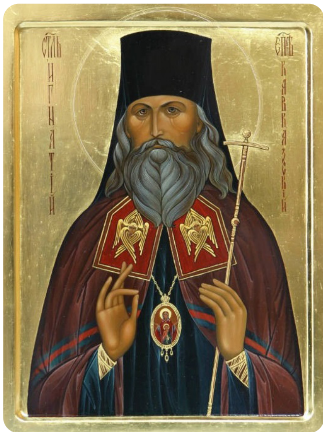
Sfântul Ignatie Briancianinov

Erezia este un păcat săvârșit, în primul rînd, cu mintea. Acest păcat, fiind primit de minte, se împărtășește duhului, se revarsă asupra trupului, spurcă chiar trupul nostru, ce are putința de a primi sfințire din împărtășirea cu harul dumnezeiesc și de a se spurca și molipsi prin împărtășirea cu duhurile căzute. Acest păcat este cu greu băgat de seamă și anevoie priceput pentru cei care nu cunosc bine creștinismul, și ca atare prinde lesne în cursele sale simplitatea, neștiința, mărturisirea nepăsătoare și superficială a creștinismului.