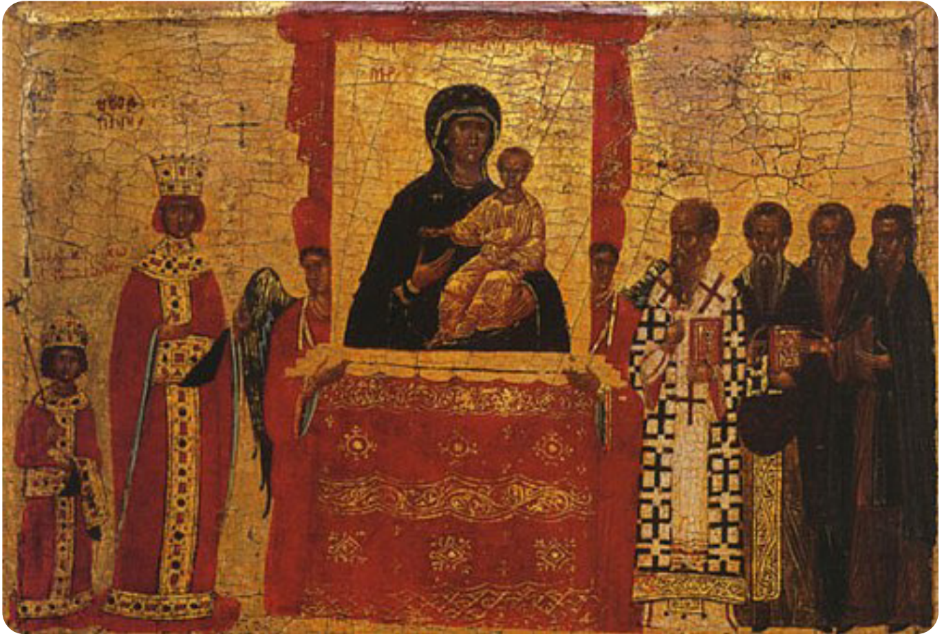
Icoana Triumful Dreptei Credițe (secolul al XV-lea)

nu o va păzi omul întregă și fără de prihană, fără nici o îndoială, va pieri pe veci”.