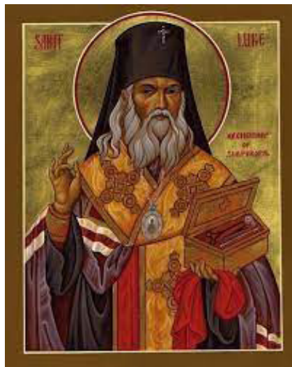
Sfântul Ierarh Luca al Crimeei, 1877-1961

Iată calea arătată oamenilor obișnuiți, creștinilor de rând – dar mulți dintre noi merg pe această cale, mulți dintre noi realizează atât de adânc însemnătatea pocăinței? Nicidecum. Cei mai mulți cred că este