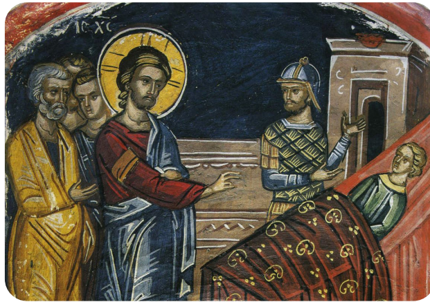
Vindecarea slugii sutașului - frescă

Hristos nu S-a mărginit să-l laude pe sutaș doar prin cuvinte, ci i-a dat, în schimbul credinței sale, sănătos pe cel bolnav, îi împletește cununa strălucită și-i făgăduiește mari daruri, grăindu-i așa: