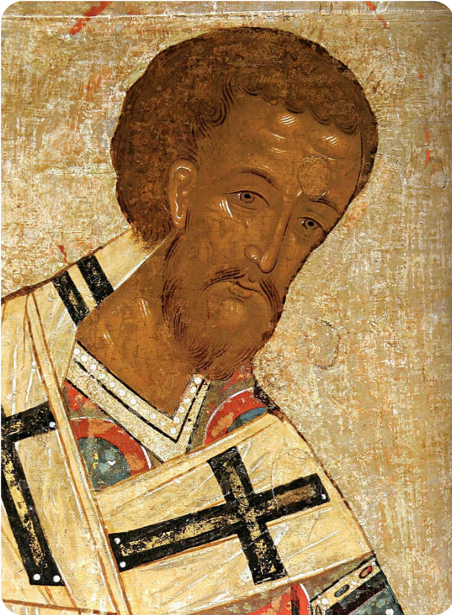
Sfântul Ioan Gura de Aur

Tu nu-mi cerceta numai cuvintele sutașului, ci adaugă la ele și slujba lui, și atunci vei vedea virtutea bărbatului.