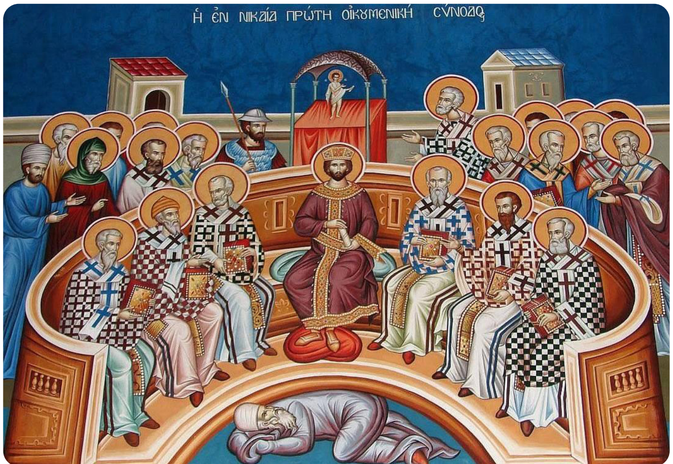
Duminica sfinților părinți de la Sinodul I ecumenic

„Aceasta este, deci, zice, viața veșnică: Să Te cunoască pe Tine, singurul Dumnezeu adevărat, și pe Iisus Hristos pe Care L-ai trimis.” Deci va zice cineva dintre cei ce nu trec repede peste dogmele dumnezeiești, cum cunoașterea este viața veșnică și ajunge cuiva să cunoască pe Dumnezeu Cel adevărat și prin fire, ca să aibă toată asigurarea nădejzii, neavând nevoie de nimic din celelalte? Dar atunci, cum „credința fără fapte este moartă” (Iac. 2, 20)? Dar când zicem