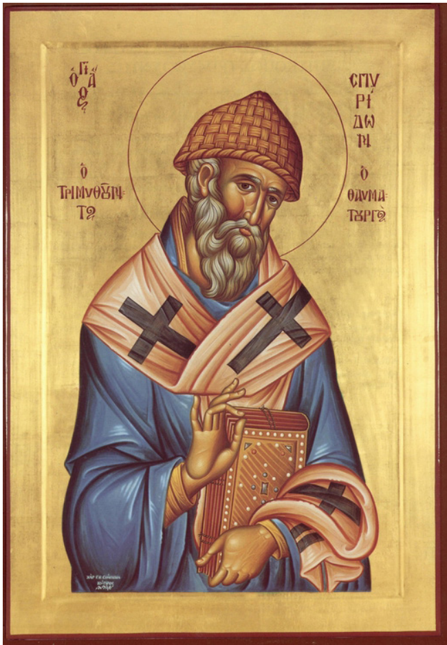
Sfântul Ierarh Spiridon al Trimitundeii

În discuția pe care a aprins-o înfricoșatul Arie prin cultura lui filosofică, cu șiretenia și cu limbuția lui, dar și cu adeptii săi retori care îl întăreau, arunca adevărate fulgere împotriva adevărului și a Bisericii lui Hristos. Orele treceau fără un rezultat pozitiv. La un moment dat mai ales, unul dintre cumplitii retori ai lui Arie, păgânul Evloghie, a adus asemenea argumente și cu atâta măiestrie meșteșugite, încât se putea crede că dreptatea se afla de partea lor. Apărătorii adevărului creștin și însuși Atanasie cel Mare au tăcut. O tăcere de moarte s-a întins timp de câteva secunde în marea sală a sinodului. În acea clipă, Sfântul nostru s-a ridicat de la locul său și a cerut să vorbească. Încet, a înaintat la tribună.