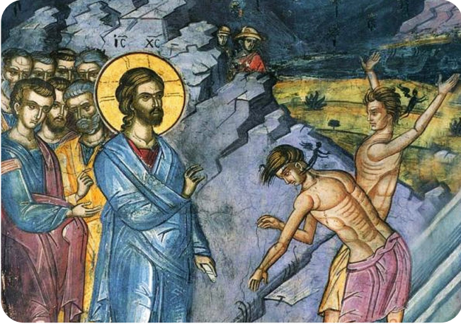
Vindecarea celor doi demonizați din Ținutul Gadara

un gând de păcat, așa-zisul atac, pe care credem că putem să-l traducem și prin momeală. El este prima răsărire a gândului simplu că am putea săvârși cutare faptă păcătoasă, înfățișându-se în fața minții ca o simplă posibilitate. El încă nu e un păcat, pentru că noi încă n-am luat față de el nici o atitudine. E parcă în afară de noi, nu l-am produs noi și nu are încă decât un caracter teoretic, de eventualitate neserioasă, care parcă nici nu ne privește serios pe noi, care suntem preocupați cu toată ființa de altceva. Nu știm cum a apărut, parcă cineva s-a jucat aruncându-ne pe marginea drumului, pe care se desfășoară preocuparea cugetului nostru, această floare fără nici un interes, ca să o privim o clipă și să trecem mai departe. Are prin urmare toate caracteristicile unui gând aruncat de altcineva, și de aceea Sfinții Părinți îl atribuie Satanei. El e gândul simplu al unei eventuale fapte păcătoase, nezugrăvindu-ne încă nici o imagine concretă a acelei fapte și a împrejurărilor în care s-ar putea săvârși (3). Sunt și cazuri însă când se stârnește dintr-odată ca un foc ce ne aprinde imediat.